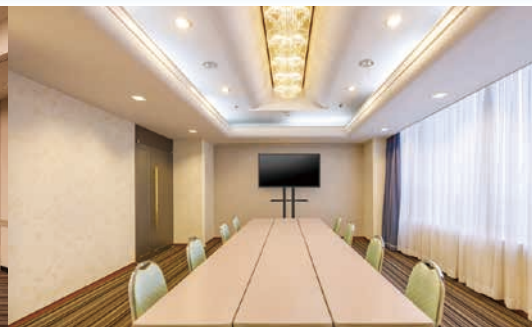
Room C, D