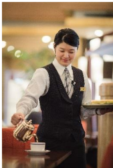
平成 26 年入社 DC レストラン