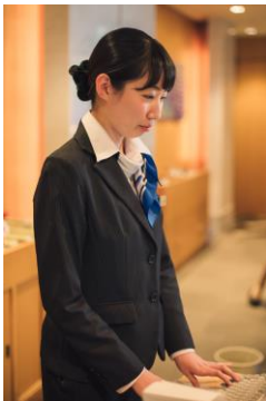
平成 27 年入社 宿泊フロント

ホテルパーソンとしての役割を自覚し、自身を業界のお手本として志向するタイプやたくさんの人と出会えることで、コミュニケーションの「楽しさ」や「やりがい」を感じるタイプが活躍しています。