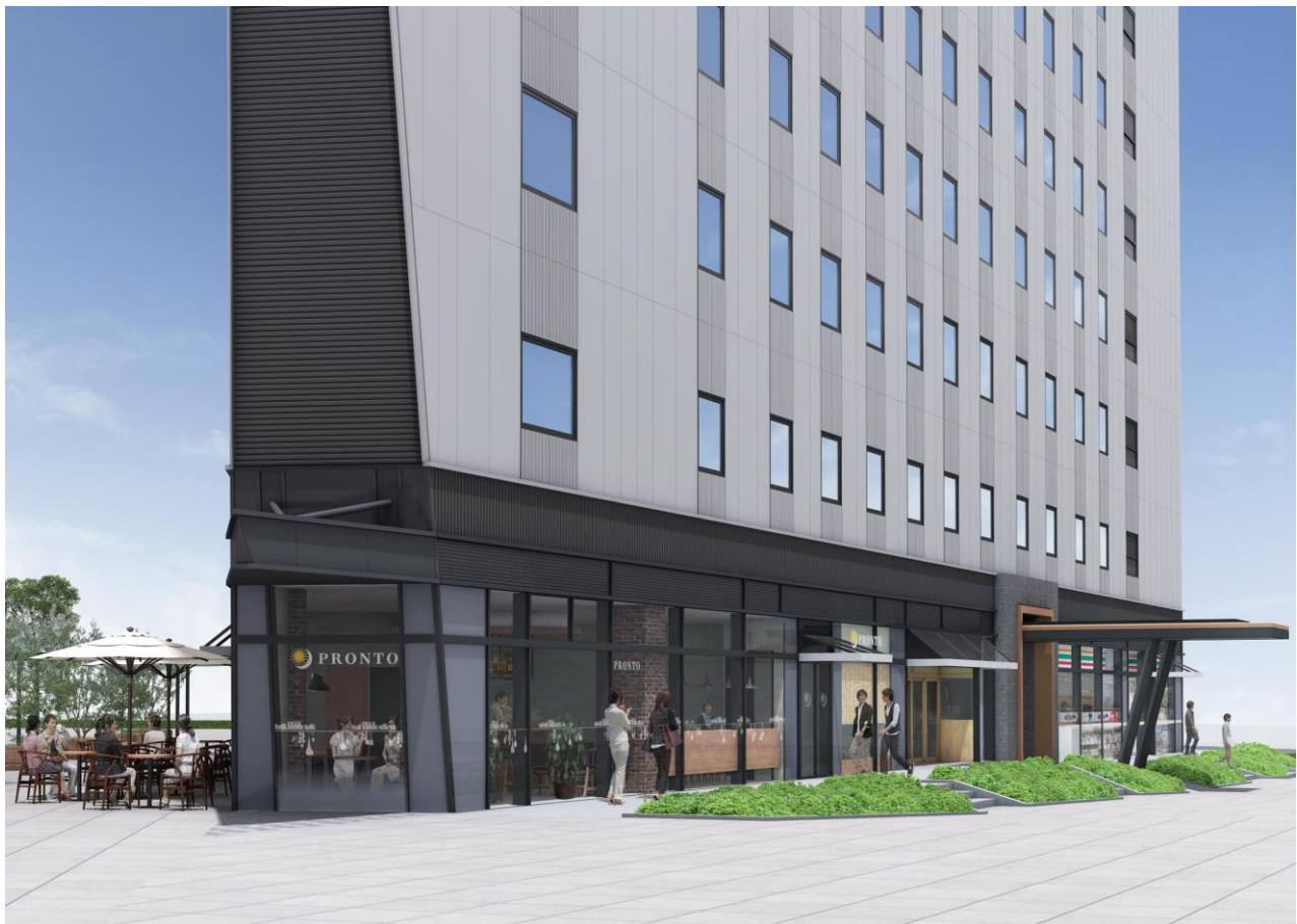
【南側道路イメージ】