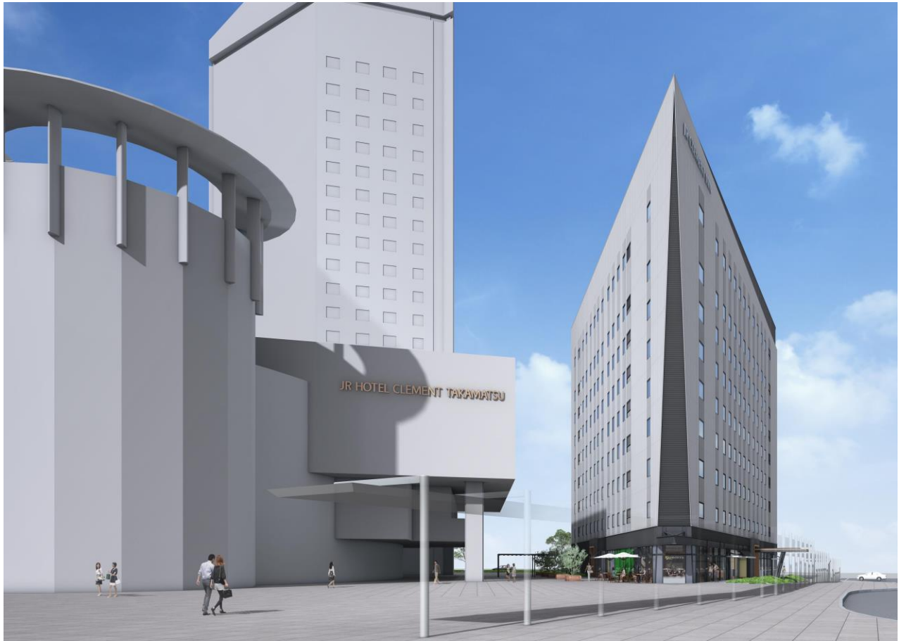
【JR 高松駅側からの外観イメージ】